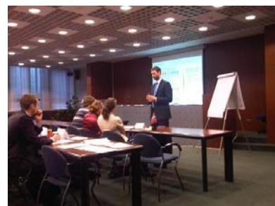
Prezentácia úseku Riziko, p. Bóďa